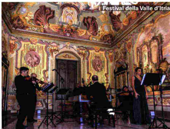
Festival della Valle d'Itria