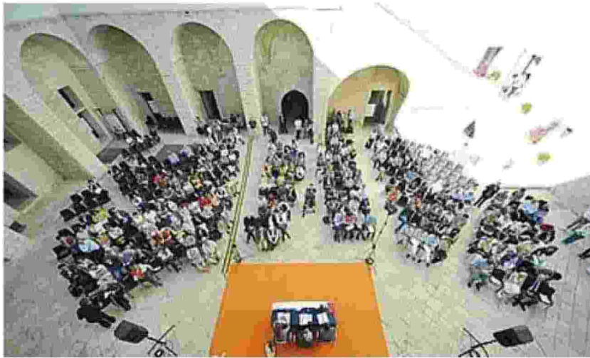
Un momento della manifestazione dello scorso anno che si svolge in alcuni dei più suggestivi luoghi di Trani. Sotto due degli ospiti di oggi, lo storico Luciano Canfora e l'editorialista del Corriere della Sera Ferruccio de Bortoli

E da oggi di questo discuteranno scienziati, economisti, intellettuali e illustri firme del giornalismo ai Dialoghi di Trani, in programma sino a domenica. La manifestazione è alla ventesima edizione. E nell'anno della scomparsa di Franco Cassano non poteva non partire dalle riflessioni del padre del «Peniero meridiano», dall'attualità di una filosofia del vivere sostenibile che muove dal Sud e al tempo stesso si propone competitiva e innovativa. Un momento dedicato al sociologo barese dalle 17.15 sarà il momento centrale, in piazza Duomo, della cerimonia d'inaugurazione dei Dialoghi 2021, iniziativa che in questa prima giornata toccherà i temi del caporalato con lo scrittore e attivista camerunense Yvan Sagnet a colloquio in Cattedrale (ore 19) col direttore del Gruppo Megamark, Francesco Pomari-