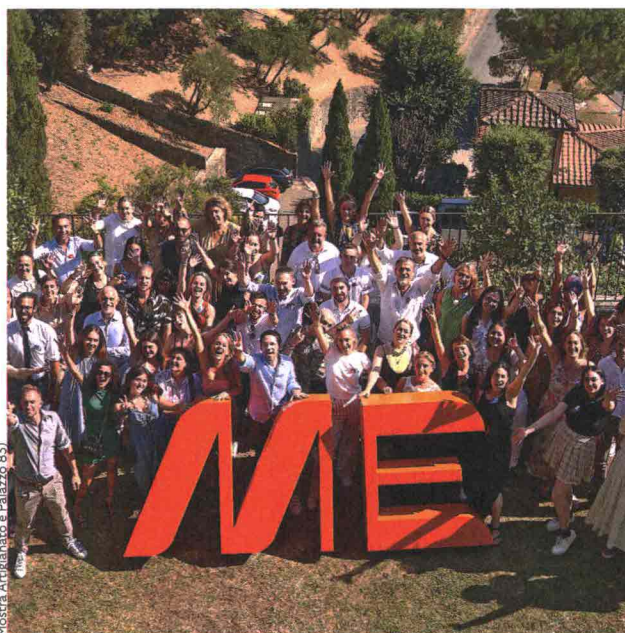
Mostra Artigianato e Palazzo 89

Dove Piazza Quercia / Info idialoghiditrani.com ▲