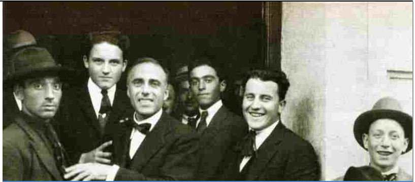
▲ Giacomo Matteotti esce da Montecitorio con alcuni compagni socialisti, pochi giorni prima di essere assassinato dai fascisti